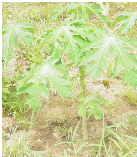
Photo : jeune plant de papayer planté le 25/06