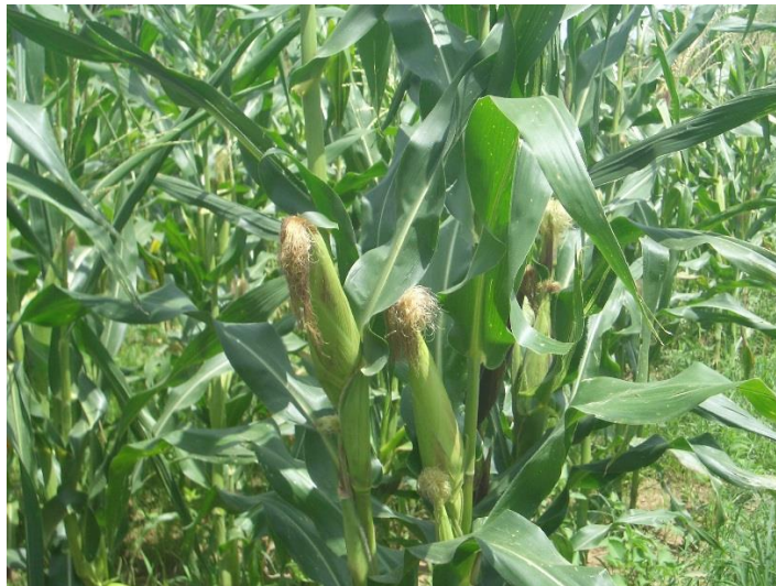
Stade épiaison du maïs au 01/09/2016