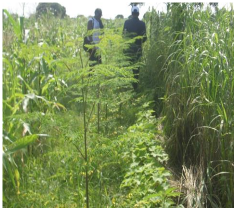
Photo : double haie de moringa et de jatropha le long du grillage au 01/09/2016