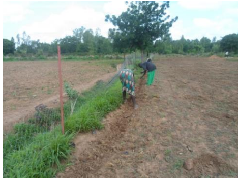
Photo : semis de Jatropha le 2 juillet 2016