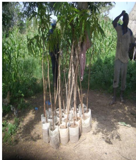
Photo : Plants de manguiers