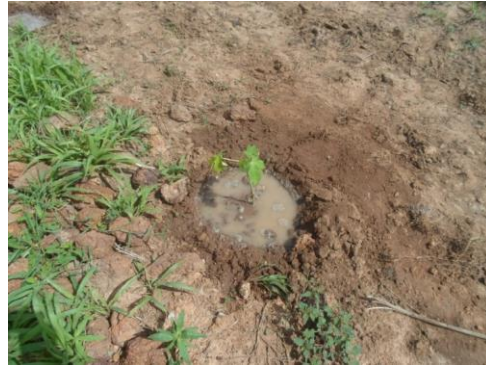
Photo : jeune pied de papayer repiqué 25/06